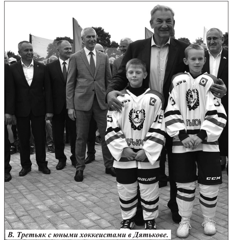
В. Третьяк с юными хоккеистами в Дятькове.

Отдельная тема — развитие лыжного спорта. В ближайших планах — строительство област-