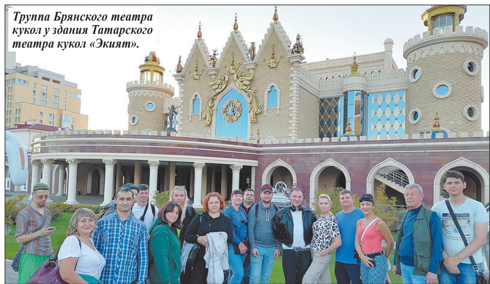
Труппа Брянского театра кукол у здания Татарского театра кукол «Экият».