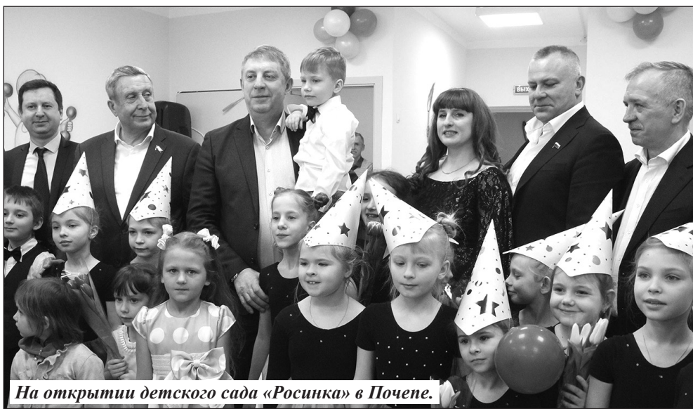
На открытии детского сада «Росинка» в Почепе.

В настоящее время в России, по данным Росстата, работает более 45 тысяч детских садов. На Брянщине с 2015 года создано более 3500 мест в детских садах. Важно, что новые учреждения появляются по всей области, обеспечивая доступность дошкольного образования практически во всех районах. Проблемой по мере открытия