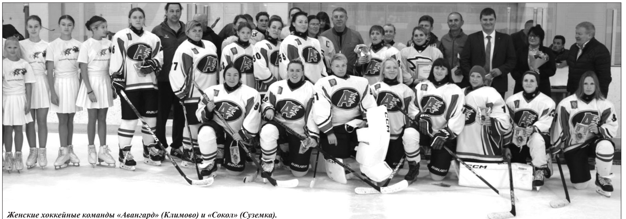
Женские хоккейные команды «Авангард» (Климово) и «Сокол» (Суземка).